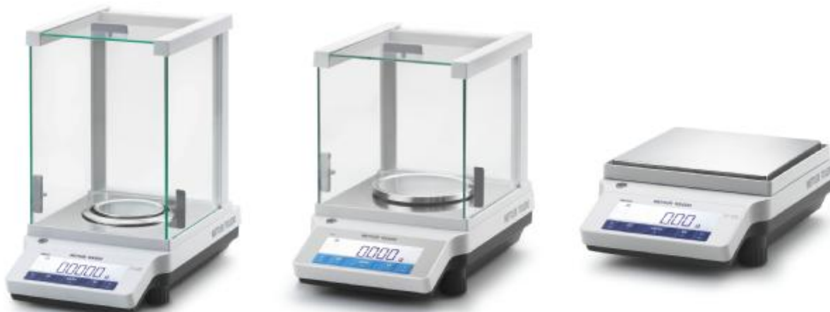
Рисунок 1 – Общий вид весов неавтоматического действия ME/TLE/JE.

Весы имеют следующие устройства и функции: